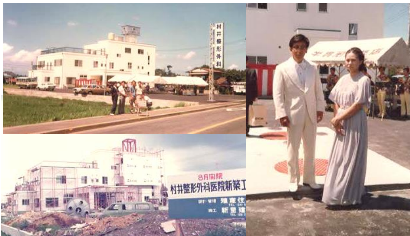
45年前建築時・開院式の様子

新しいクリニックでは、予約システムや問診システム、会計システム、遠隔診療システムなども最新のものを揃えて皆様の待ち時間短縮と利便性向上、診療の質の向上につなげたいと考えています。今後も多くの方に親しみを持って利用して頂けますことを願って新築のご案内とご挨拶とさせていただきます。