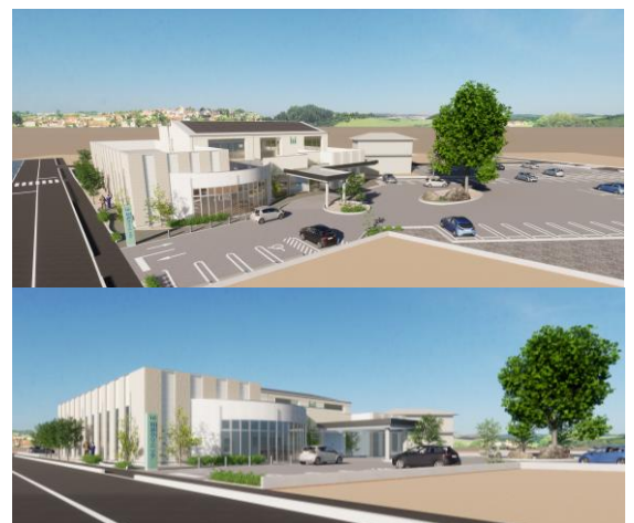
新クリニック完成予想図